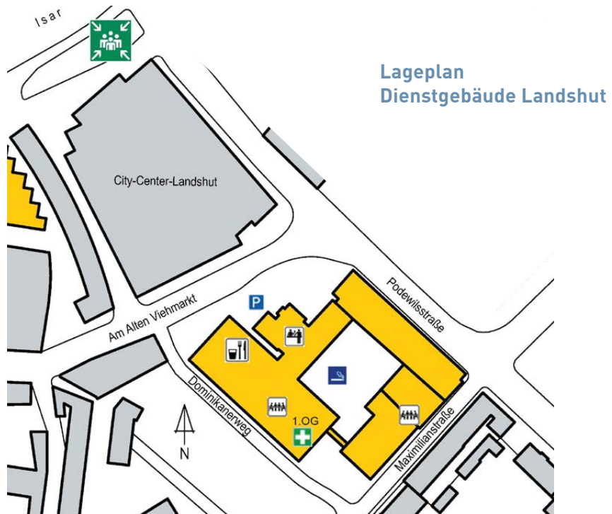
Lageplan Dienstgebäude Landshut