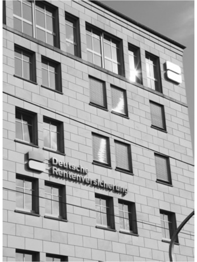
Außenansicht: Dienstgebäude Standort Dresden