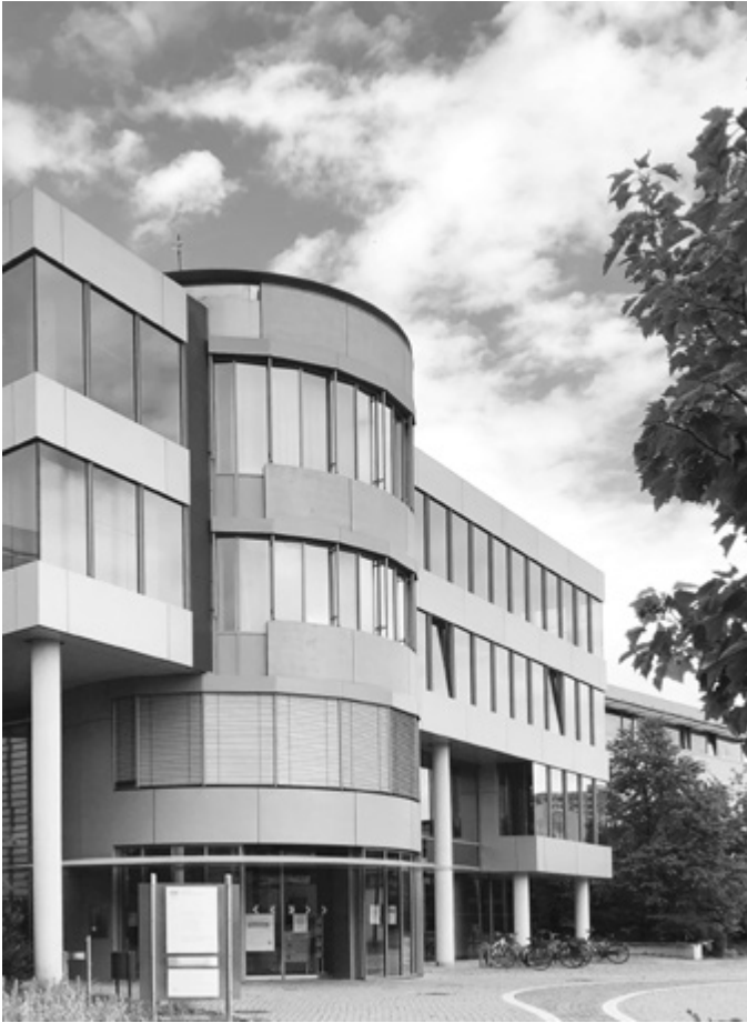
Außenansicht: Dienstgebäude Standort Erfurt