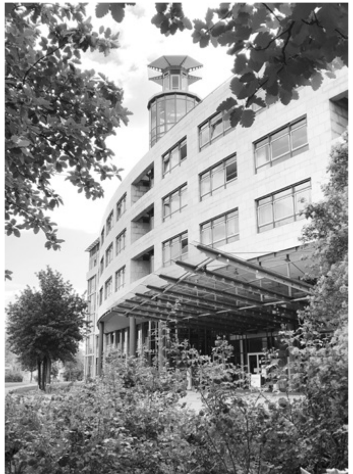
Außenansicht: Dienstgebäude Standort Halle (Saale)