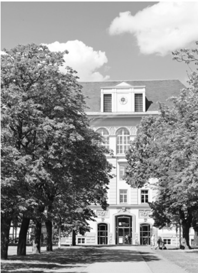
Außenansicht: Dienstgebäude Standort Leipzig