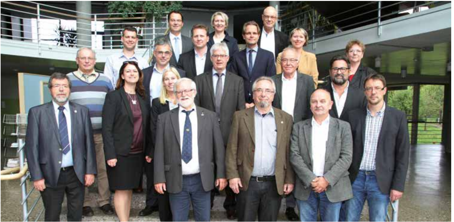
Die Mitglieder der Vertreterversammlung