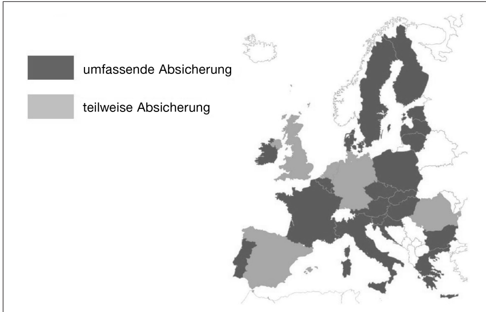
Abbildung 3: Rechtliche Absicherung von Selbstständigen im Haupterwerb im Bereich der gesetzlichen Altersrenten